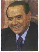
Per Silvio Berlusconi Tartare di tonno (senza cipolla)