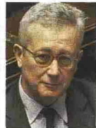
Per Giulio Tremonti Baccalà alla vicentina