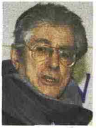
Per Umberto Bossi Pasta e fagioli