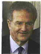
Per Fabrizio Cicchitto Cappelletti in brodo

ECONOMISTA ED ECONOMO Renato Brunetta, 60 anni, economista e politico, è dal 2008 ministro per la Pubblica Amministrazione e l'Innovazione; è anche professore ordinario di Economia del Lavoro presso l'Università degli Studi di Roma, Tor Vergata.