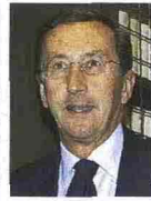
Per Gianfranco Fini Pollo alla diavola